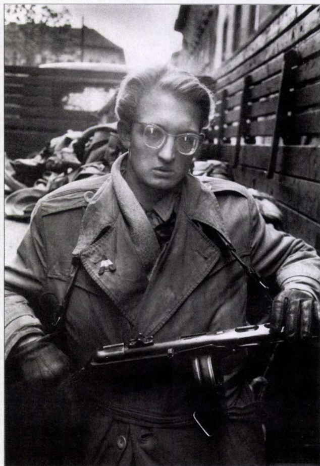
Michael Rougier felvétele, 1956 (Remember Hungary 1956 alapján)

veken füstölő-égő tank-csonk és nemzetiszínű, montázsolt lukas zászló. (Ennek alsó, zöld sávjában a designer olvashatatlansága.) A zászló előtti szűk térretegben balról sálás, svájcisapkás fiú, jobbról világos kendővel bekötött fejű lány, mindketten puskával. A „Hungarian Freedom Fighter” feliratot a mellén viselő, hosszúkarú arcú, elszánt tekintetű szabadságharcos teljes mértékben amerikaiak – hajkoronájával egy kicsit Elvis Presleyre emlékeztetőnek – van maszkí-